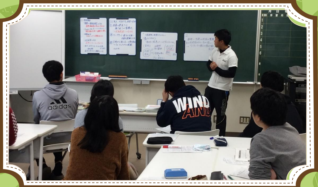
教育実践開発コース 授業風景 「教材開発演習」 2018.12.4